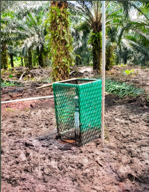
Implementasi Automatic Water Level Recorder di Kabupaten Sukamara, Kalimantan Tengah, Indonesia