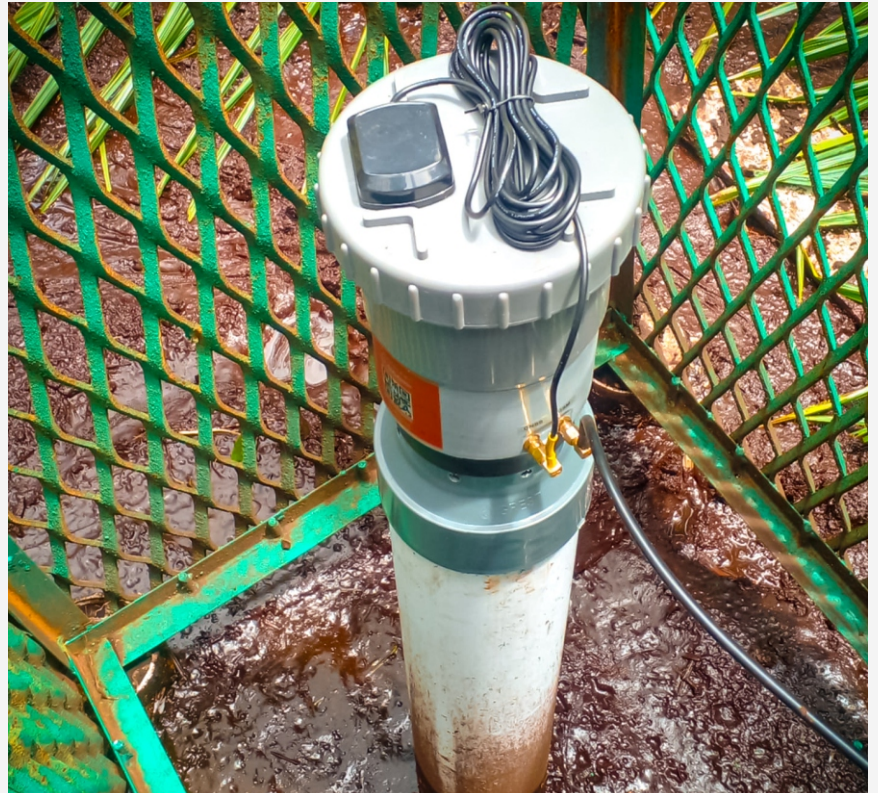
Close up short by Mertani

Karta Mulia, Kec. Sukamara, Kabupaten Sukamara, Kalimantan Tengah, Indonesia