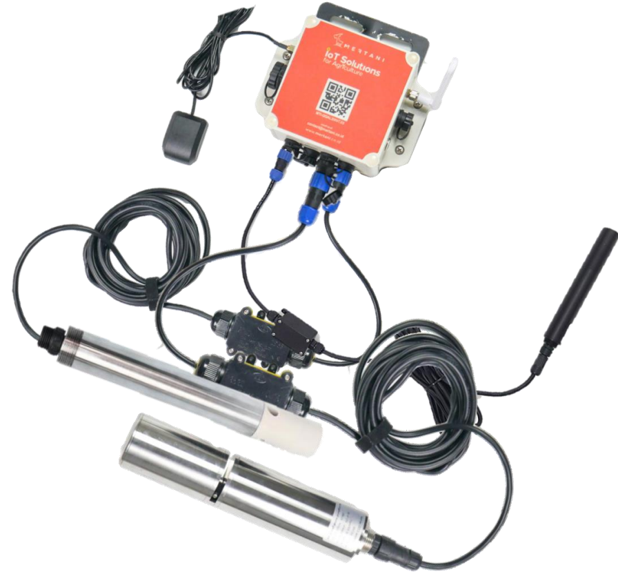
Perangkat Sparing versi Lite