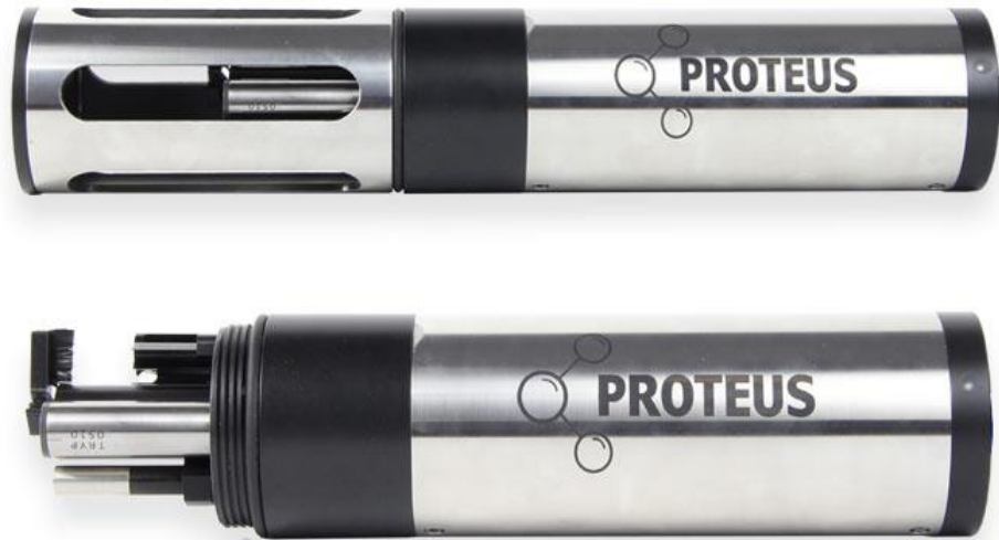
Perangkat Sparing versi Pro