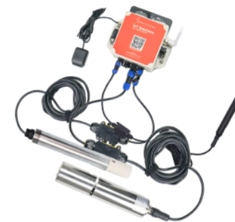
Sparing Device Mertani