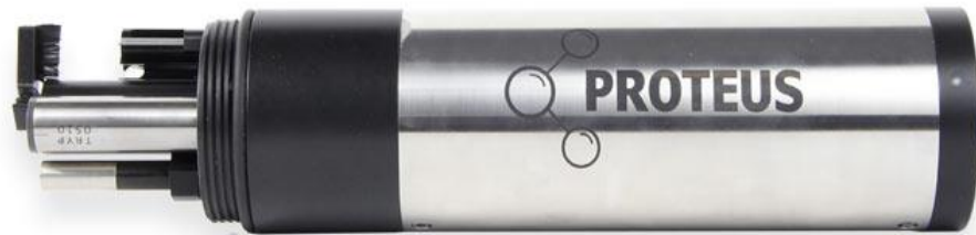
Perangkat Sparing versi Pro